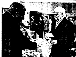
Están más cogenciados políticamente.

Los mayores de 65 años sólo representan el 5% de los cargos públicos en las principales instituciones valencianas. En Les Corts, hace ahora cuatro años, la media de edad de los electos era de sólo 42. En cambio votan mucho más que los jóvenes: un 30% de los que acuden a las urnas.